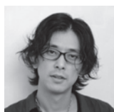
MARBOH / MAGNOLIA