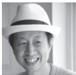
VAN / Cocoon