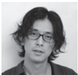
MARBOH / MAGNOLiA